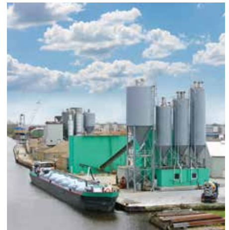
Niet bindend, wijzigingen onder voorbehoud Versie 2017 / 1.1

Betonmengers, weegbunkers, silo's, buissystemen, glijgoten, trechters (zand, grint en mineralen), overstort- en valpunten, schrapers, elevatoren en morsranden voor bandtransporteurs, etc.