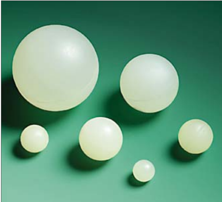
KAROLEE® polyurethaan zeefballen rollen en